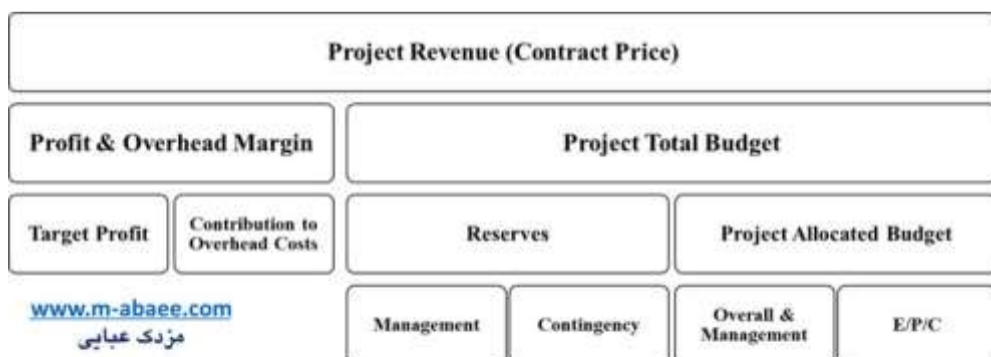
نمونه‌ای از ساختار کلان هزینه‌ها در یک پروژه با قرارداد EPC