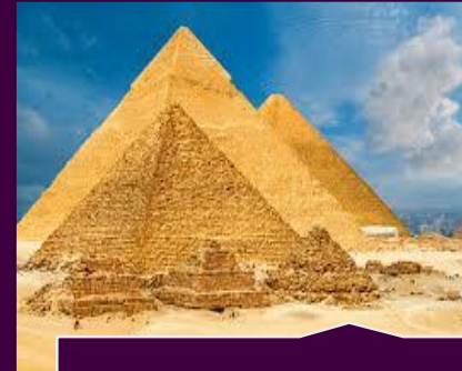
Pyramids of Giza