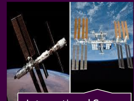
International Space Station